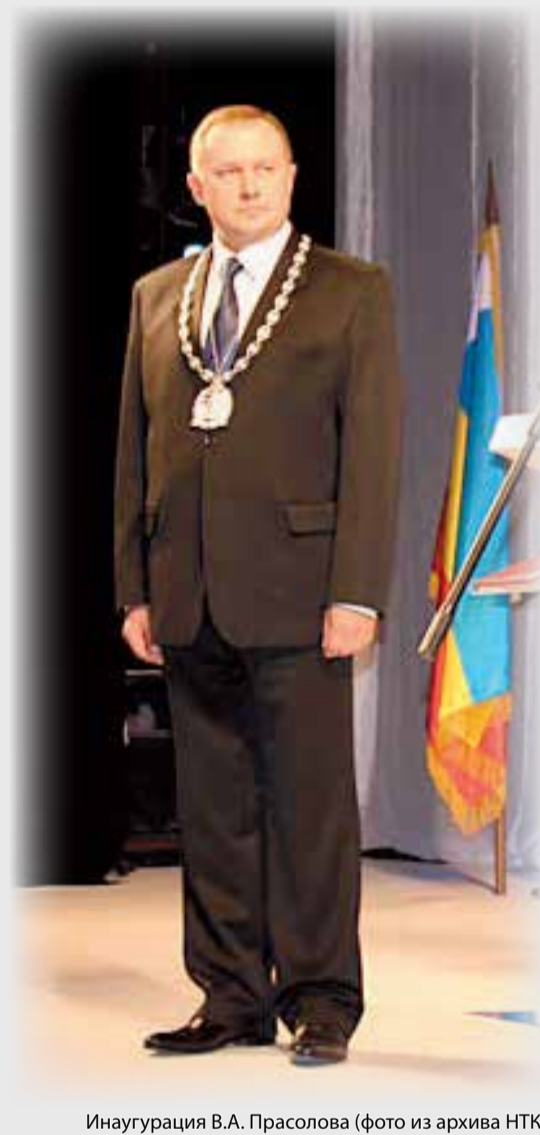
Инаугурация В.А. Прасолова