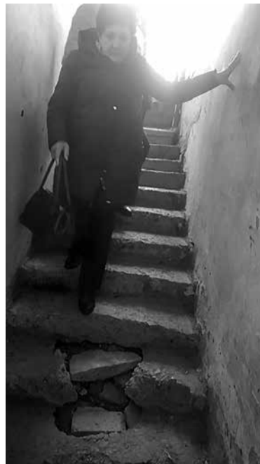
В таком состоянии оказался спуск в подвал дома по ул. П.Тольятти, 1.

Помимо других городов, в конце года члены общественного совета побывали на объектах капремонта в Таганроге. Это два